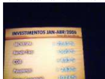
Foto de Entrevista no Bom Dia Brasil e Quadro com dados fornecidos pela EFC, 2006